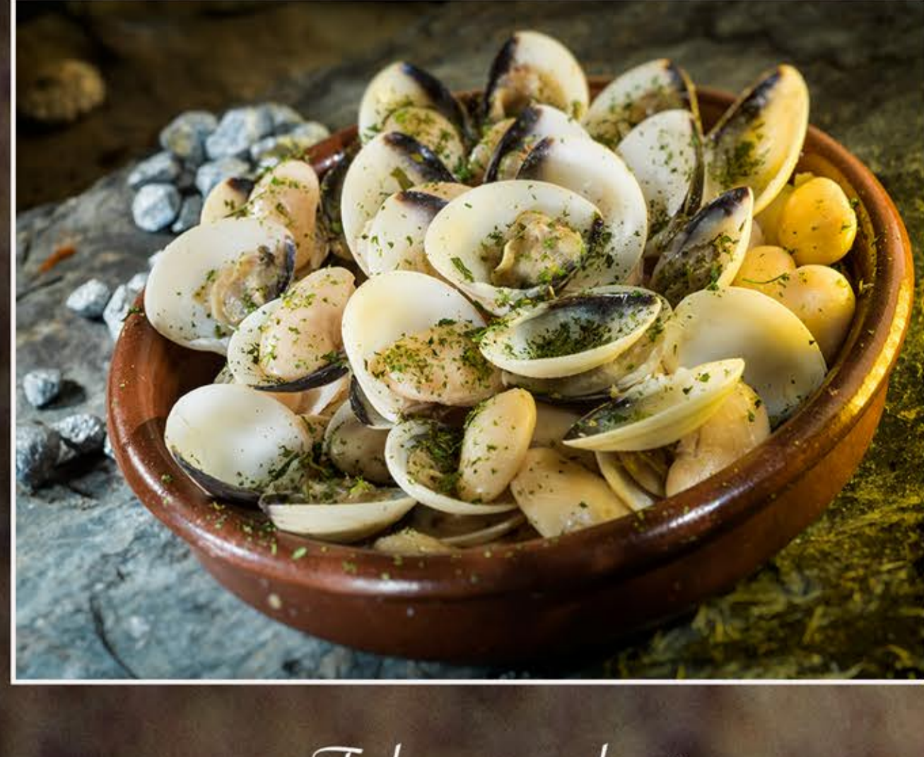
Fabes con almejas Venusmuscheln mit bohnen "seemansart" Jewish with clams