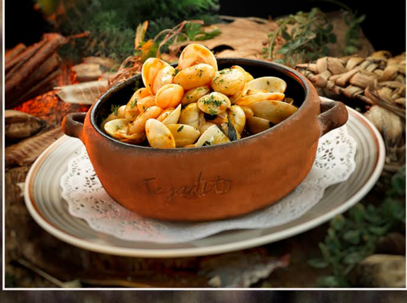
Fabes con almejas a la marinera Venusmuscheln mit bohnen "seemansart" Jewish with mariner clams