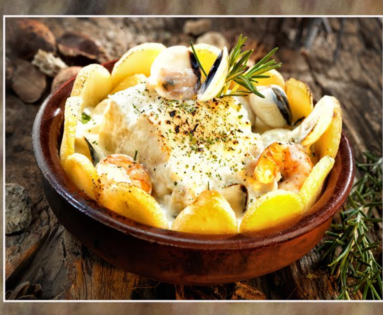
Bacalao al cava Kabeljau in sektsosse Garlic in champagne