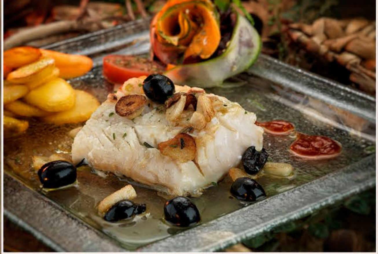
Bacalao al ajillo Kabeljau in knoblauch Garlic cod